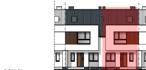
ELEWACJA POŁUDNIOWO - ZACHODNIA