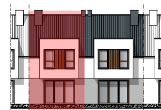
ELEWACJA PÓŁNOCNO - WSCHODNIA