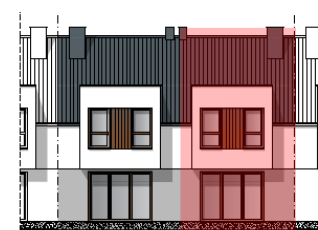
ELEWACJA PÓŁNOCNO - WSCHODNIA