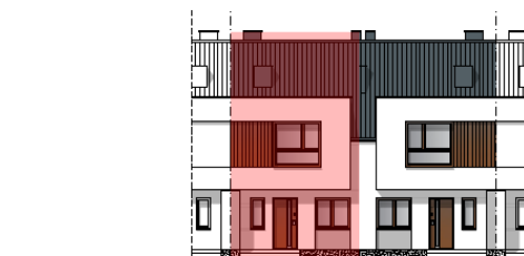
ELEWACJA POŁUDNIOWO - ZACHODNIA