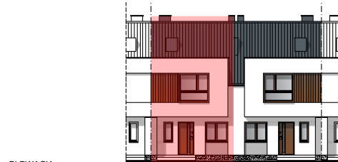
ELEWACJA POŁUDNIOWO - ZACHODNIA